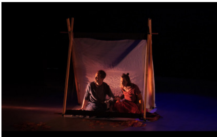
TABLEAU 1 :

Vous trouverez ci-dessous un exemple de découpage (pour un groupe de 12 enfants) qui pourra vous servir pour mener ces ateliers d'improvisation théâtrale. Les groupes sont faits spontanément et peuvent changer suivant les séances, le nombre d'enfants participants peut être aisément augmenté en créant des groupes supplémentaires ou en intégrant plus de jeunes acteurs dans chaque groupe. Les enfants disposent de quelques minutes pour se répartir les rôles des protagonistes qu'ils souhaitent interpréter, une ambiance sonore peut leur être apportée telle que les bruits d'animaux nocturnes les mettant ainsi en situation d'écoute active et de réaction spontanée. Il s'agit de leur rappeler avant le début de l'improvisation le contenu du tableau qu'ils vont jouer et de les laisser jouer leur scène dans un temps imparti.