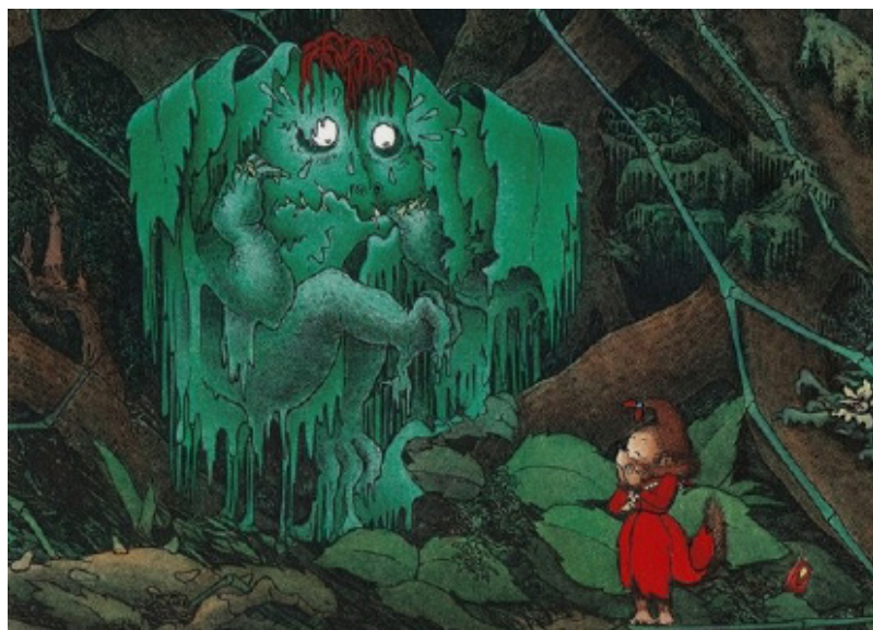
Illustration extraite de «L'Arbre sans fin» de Claude Ponti

L'œuvre de Claude Ponti dépeint avec finesse et délicatesse l'univers complexe de l'enfance, où les émotions sont tourbillonnantes et l'imagination foisonnante. L'histoire agit comme un catalyseur, nourrissant leur désir d'apprendre, de grandir et de s'affirmer. Ainsi, cette pièce de théâtre se révèle bien plus qu'un simple divertissement : elle devient une source d'inspiration et un terrain fertile pour cultiver leur potentiel.