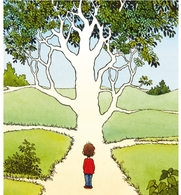
Illustration extraite d' «Enfances» de C.Ponti

La possibilité de monter « la tente » est pour nous l'occasion de faire raisonner sur scène la «langue de Ponti », de donner vie à ses tableaux qui viennent si particulièrement stimuler notre imaginaire. « La Tente » est riche de tout son univers passionnant et comme le dit si bien Claude Ponti : «Tout ce qui peut amener à fréquenter les profondeurs de nos propres émotions est intéressant»